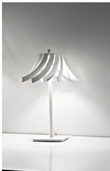
Lume 1 luce - 1056 - Panama - Selene illuminazione