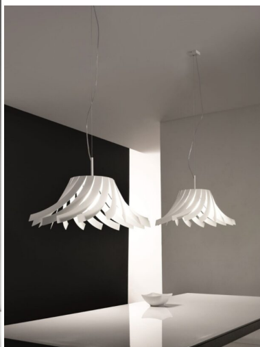
Sospensione 1 luce - 1054 - Panama Selene