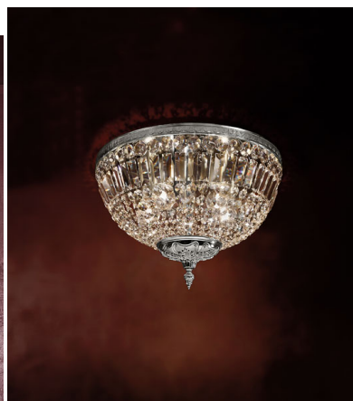
Plafoniera 3 luci bronzo e cristallo - 540/PL30 - Luxury Crystal - Arredoluce