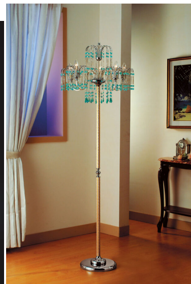
Lampadario 6 luci oro e cristallo - 406/6 -Royal Crystal - Arredoluce