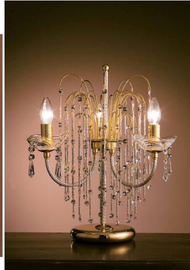
Lume 3 luci oro e cristallo- 413/L3 Royal Crystal Arredoluce