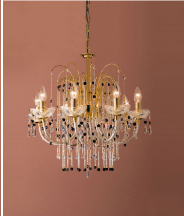
Lampadario 8 luci - 413/8 - Royal Crystal - Arredoluce