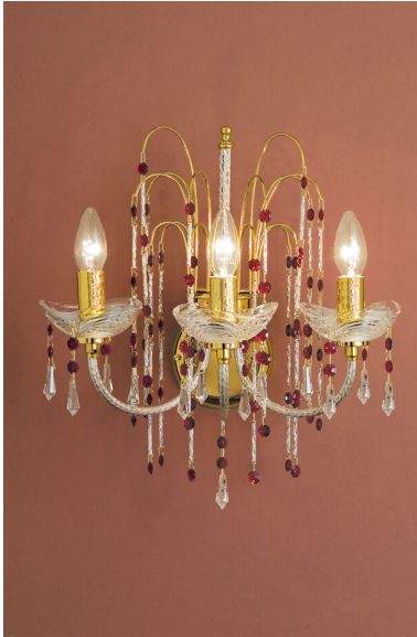
Applique 3 luci 413/A3 Royal Crystal Arredoluce