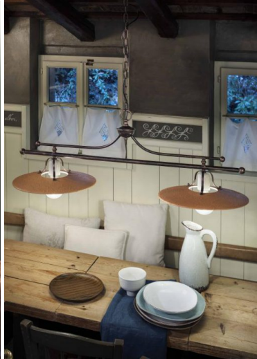
Ferroluce Classic Bologna bilanciere 2 luci C826