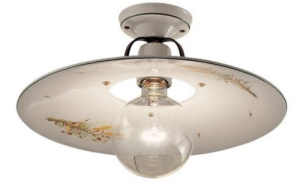
Ferroluce Classic Bologna plafoniera 1 luce C828