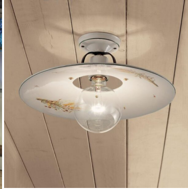
Ferroluce Classic Bologna plafoniera 1 luce C829