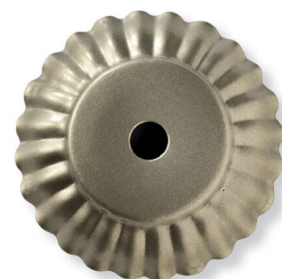
AG - Argento Silver