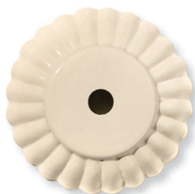
BI - Bianco White