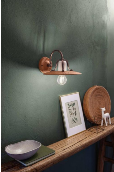
Ferroluce Classic Bologna applique 1 luce C820