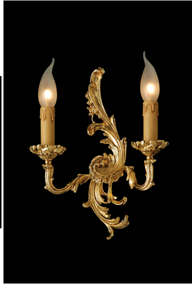
Applique 2 luci fusione di ottone - 12.628/2 -Gold Light and Crystal - Arredo Luce