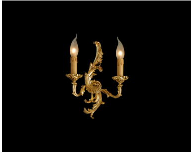
Applique 2 luci fusione di ottone - 12.629/2 - Gold Light and Crystal - Arredo Luce