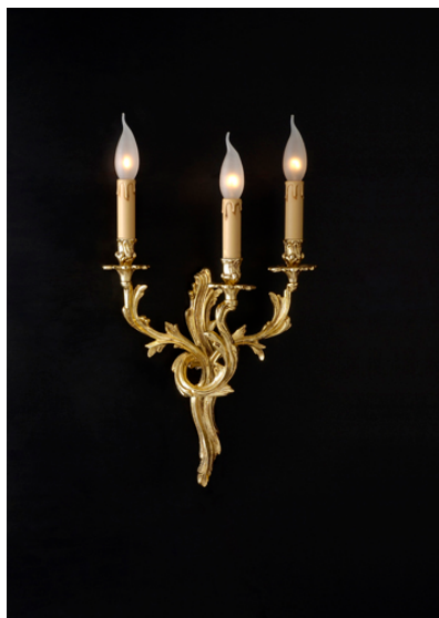
Applique 3 luci in fusione di ottone - 12.206/3 -Gold Light and Crystal - Arredo Luce