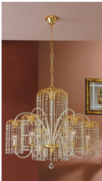
Lampadario 6 luci oro e cristallo 408/6 Royal Crystal Arredoluce