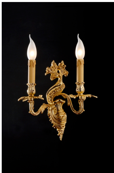
Applique 2 luci in fusione artistica di ottone- 12.601/2 - Gold light and Crystal - Arredo Luce