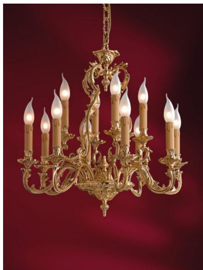
Lampadario 12 luci in fusione artistica di ottone - 12.662/8+4 - Gold Light and Crystal - Arredoluce